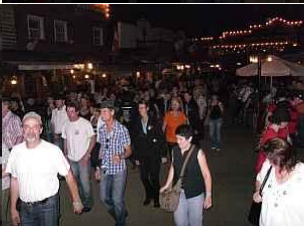
Party - Party - Party