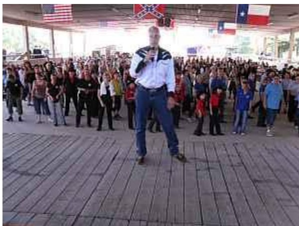
Nochmalige Wiederholung des Benefiztanzes von Choreograph Kurt Fluger