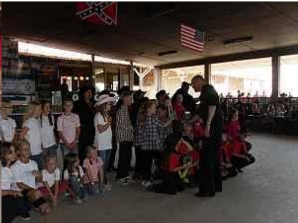
Gummibärchen für die mutigen Tänzer und Tänzerinnen