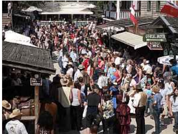
Das Highlight: Der Tanz auf der Mainstreet